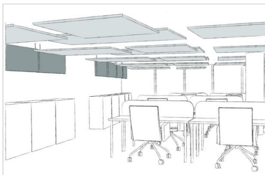
Proposition panneaux décalés verticalement