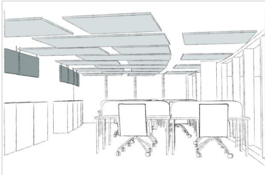
Proposition panneaux alignés verticalement